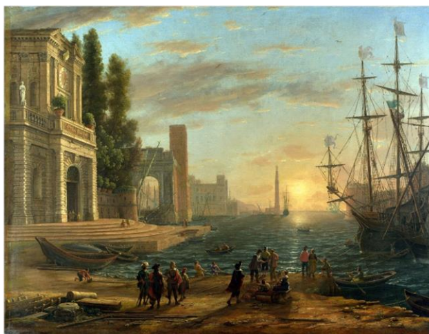
Le Lorrain, Port de mer (Londres, National Gallery)

La mobilité du duo lui permet de se produire dans des lieux insolites (Conservatoire National des Arts et Métiers, concerts en maison ou appartement, galeries) autant que dans des salles de concert ou des églises . Grâce au soutien du Conservatoire Maurice Ravel (Paris 13 ème ), ils jouent le programme Vague à l'âme en EHPAD et en école élémentaire durant le confinement du printemps 2021.